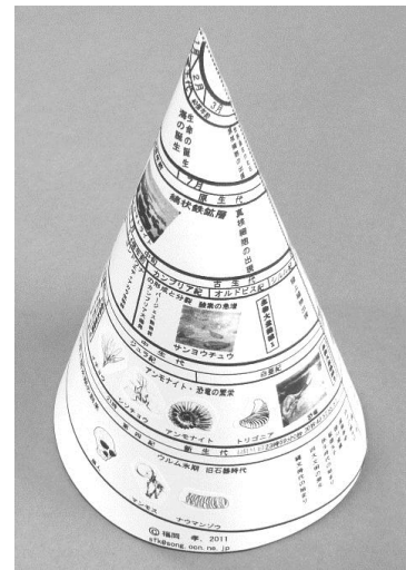
生命の歴史スタンド