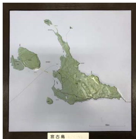
図5. 宮古島（低島） 琉球石灰岩の島