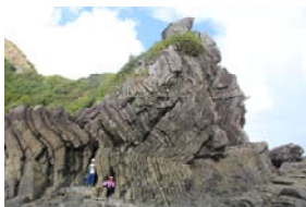
図3. 沖縄島北部（高島） 嘉陽層（砂岩泥岩） 新生代古第三紀

ひょうこう たか やま おお しま こうとう こせいだい しんせいだい こだいさん き ふる がんせき ぶんぶ ② 標高が高く山の多い島（高島）には古生代～新生代古第三紀の古い岩石が分布。