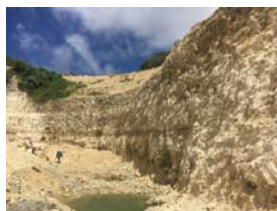
図4. 沖縄島南部（低島） 琉球石灰岩 新生代第四紀更新世