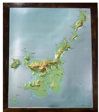
図6. 石垣島（高島） 様々な岩石が分布。石の博物館と呼ばれる